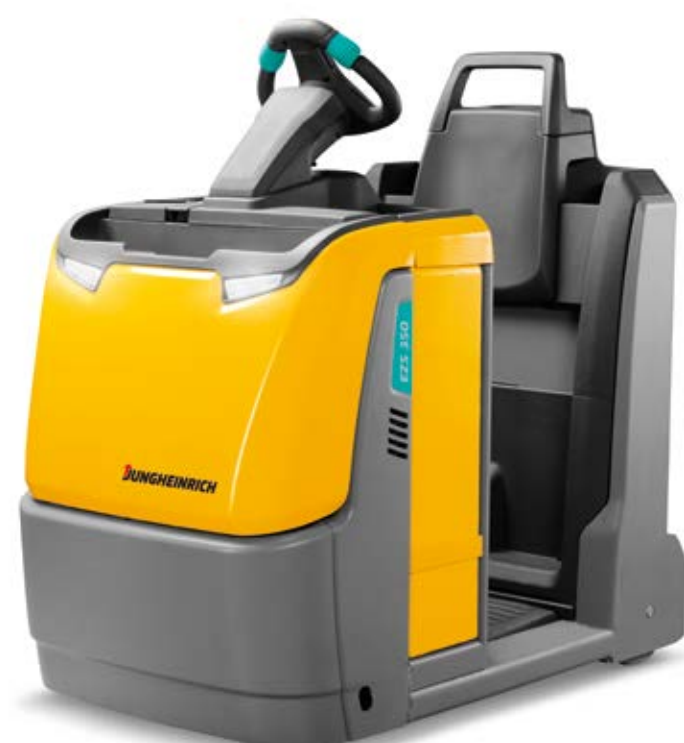
Bis 5.000 kg Zugfähigkeit