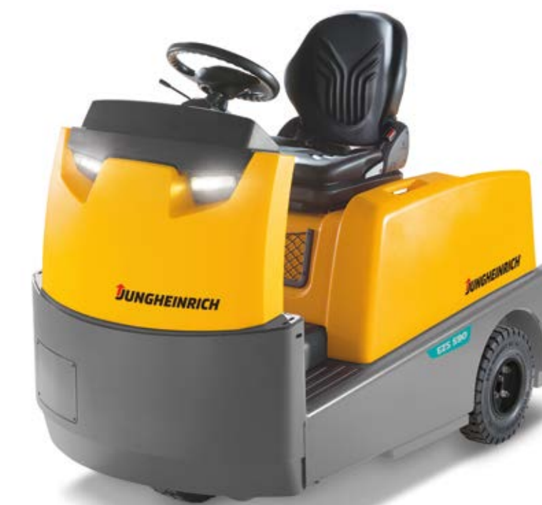
Bis 10.000 kg Zugfähigkeit