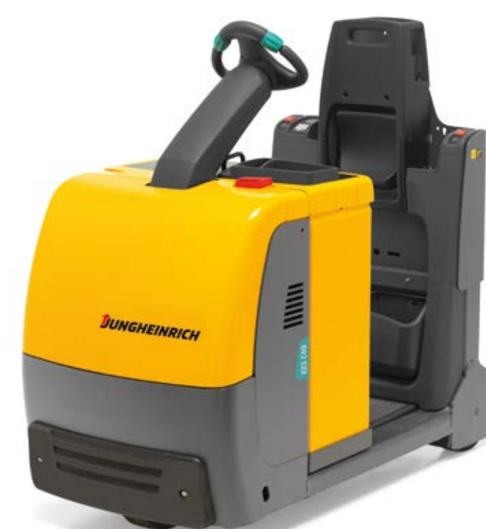
Bis 4.000 kg Zugfähigkeit