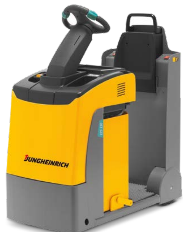
Bis 3.000 kg Zugfähigkeit