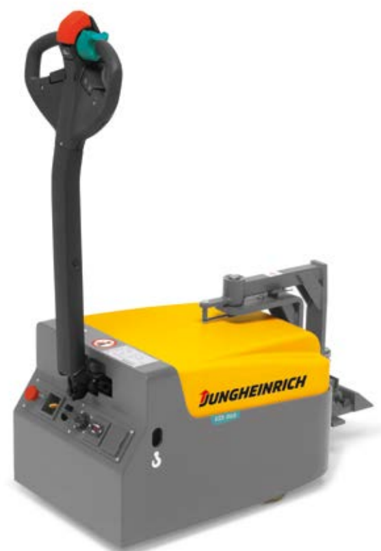
Bis 1.000 kg Zugfähigkeit