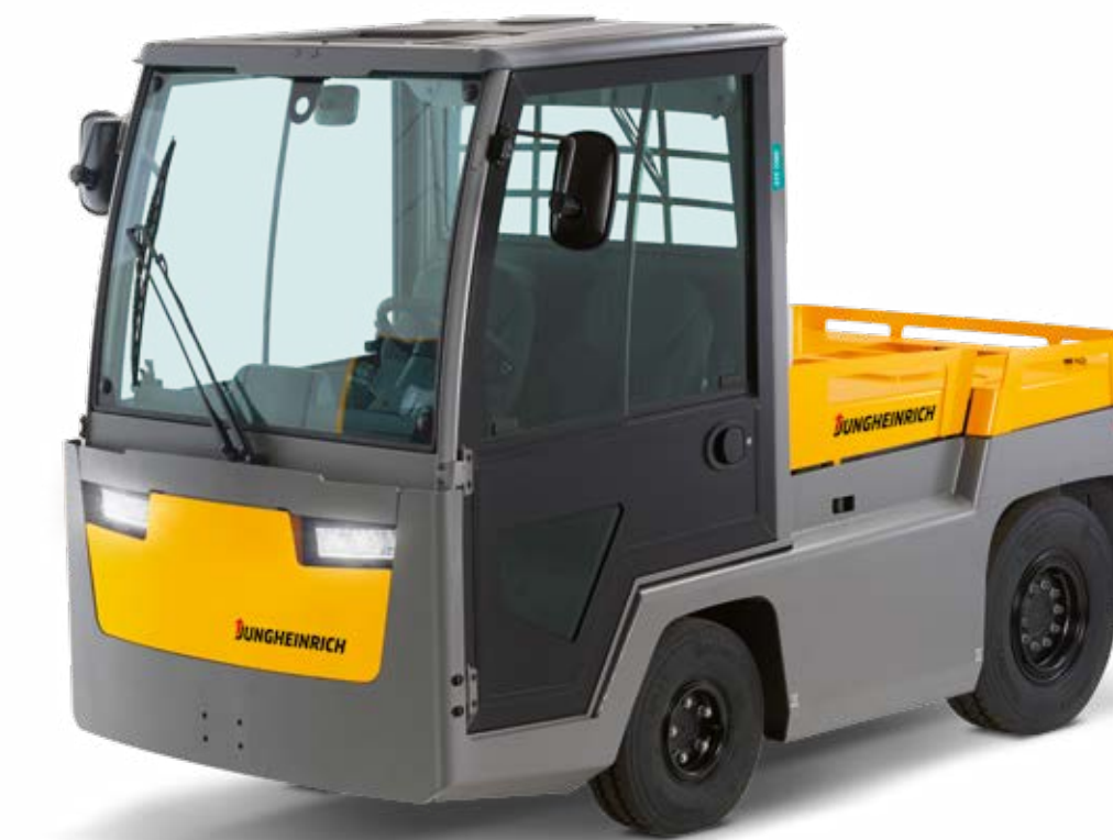
Bis 28.000 kg Zugfähigkeit