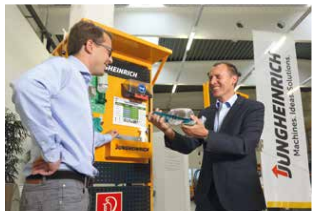
Mit Sicherheit immer richtig unterwegs