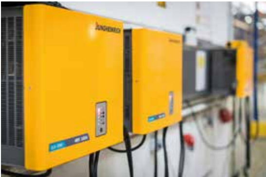
SLH 090 HF - Ladegerät

Jungheinrich plant und realisiert Ladeanlagen in Zusammenarbeit mit den Verantwortlichen im Betrieb, um alle Brandschutz-, Explosionsschutz- und Sicherheitsanforderungen zu erfüllen.