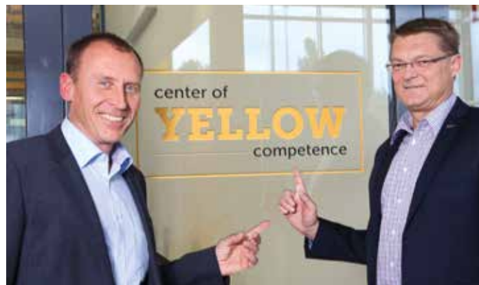
Center of YELLOW competence in der Zentrale Wien 1230

Von der Ist-Analyse über die Planung und Installation bis zur Wartung im Betrieb ist Jungheinrich Ihr kompetenter Ansprechpartner. Besuchen Sie uns gerne in unserer Zentrale in Wien 1230, Slamastraße 41!