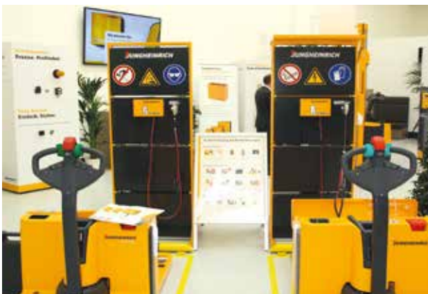
Lademodule passend für jeden Ladeplatz