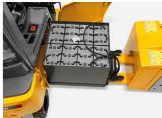
SnapFit - einfach und sicher Batterien wechseln