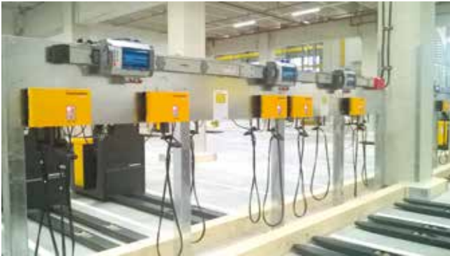
Wandmontageschiene im Lager

... inklusive Energiemanagement und personalisierter Entnahme: Wir bieten Ihnen eine große Bandbreite an verschiedenen Lösungen. Im Bereich der elektrisch angetriebenen Flurförderzeugen ist die Sicherheit bei den Batterieladestationen von großer Bedeutung. Mit individuellen Lösungen neben Batterieladegeräten bietet Jungheinrich auch zahlreiche interaktive Systemlösungen, wie z. B. First In – First Out, Auto Start-Stopp, personalisierte Entnahme, sicheres Laden von Antriebsbatterien sowie Softwarevisualisierungen und Managementsysteme an.