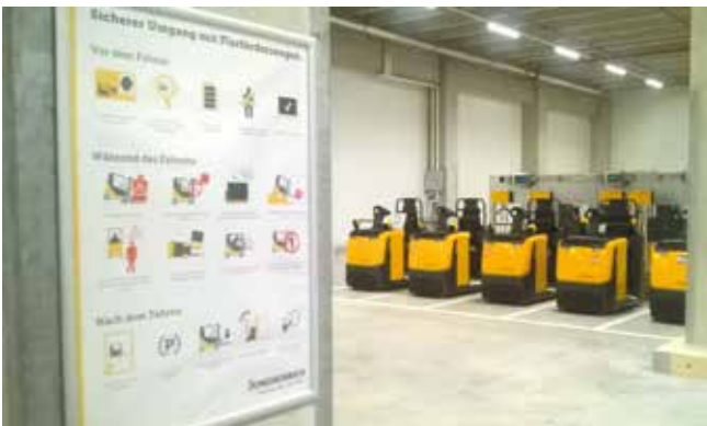
Unterweisungsplakat mit Informationen zur Verwendung der Fahrzeuge